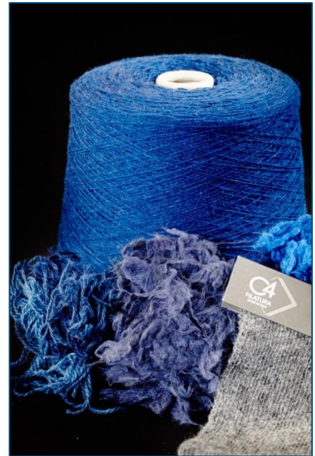
Prodotti FILATURA C4

Tutto questo si allinea perfettamente con la scelta "tecnologica e creativa" 100% made in Italy di Filatura C4, che è in grado di offrire filati Re.Verso™ re-engineered della miglior qualità, altamente performanti, senza alcun compromesso, sostituendo filati vergini e permettendo un risparmio in termini di materie prime, costi di produzione ed impatto ambientale.